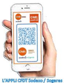
L'APPLI CFDT Sodexo / Sogeres